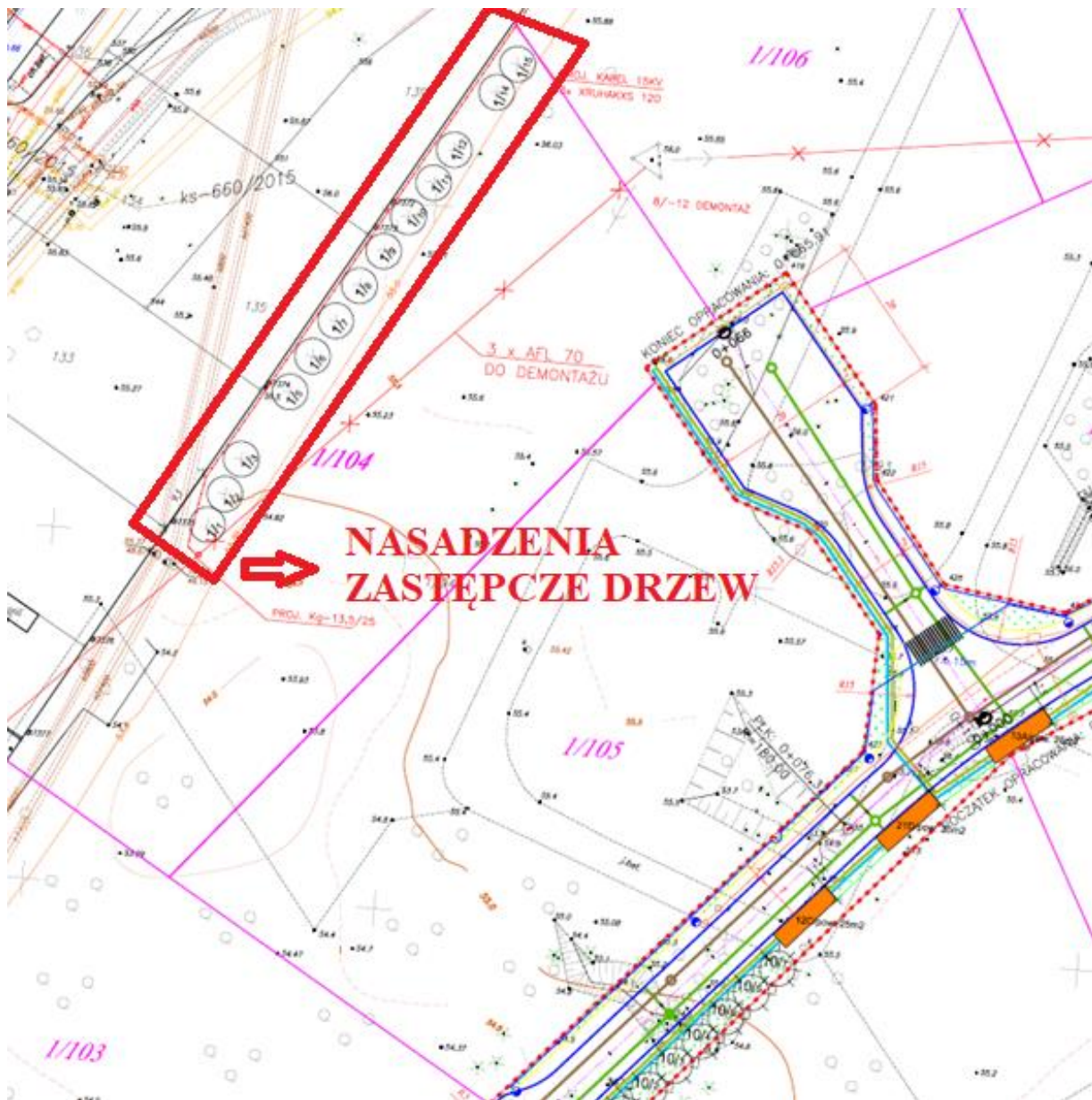
Rys.1. Lokalizacja nasadzeń szpalerowych zastępczych drzew na działce 1/104 będącej przedmiotem przetargu.

4. Kompleks działek 1/104 i 1/105 znajduje się w obszarze utrzymania funkcjonalnych korytarzy migracji (nieoperzy) wynikających z planu zadań ochronnych dla obszaru Natura 2000 – Forty w Toruniu. Według Opracowania Ekofizjograficznego z roku 2014 sporządzonego na potrzeby projektu miejscowego planu zagospodarowania przestrzennego dla obszaru położonego w rejonie ul. Gen. W. Andersa i trasy S-10 w Toruniu dla Miejskiej Pracowni Urbanistycznej, kompleksy w/w działek znajdują się bezpośrednio na trasie przebiegu północnego korytarza migracji nietoperzy (Rys.2).