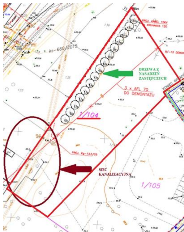
Rys.1. (fig.1) Lokalizacja nasadzeń zastępczych oraz przebiegu sieci kanalizacyjnej na działce nr 1/104.