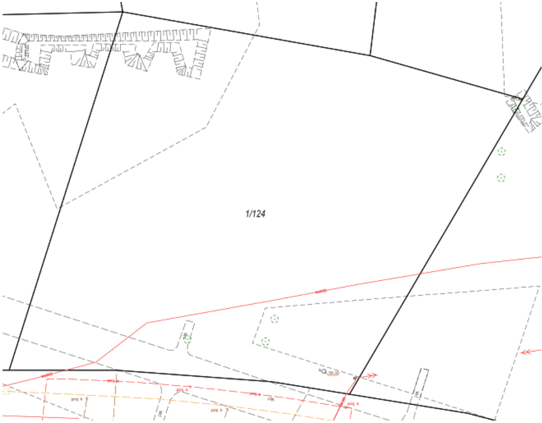
Rys.1. Lokalizacja linii elektroenergetycznej 15 kV oraz słupa energetycznego na działce nr 1/124. Fig.1. Location of the 15 kV power line and power pole on plot No. 1/124.