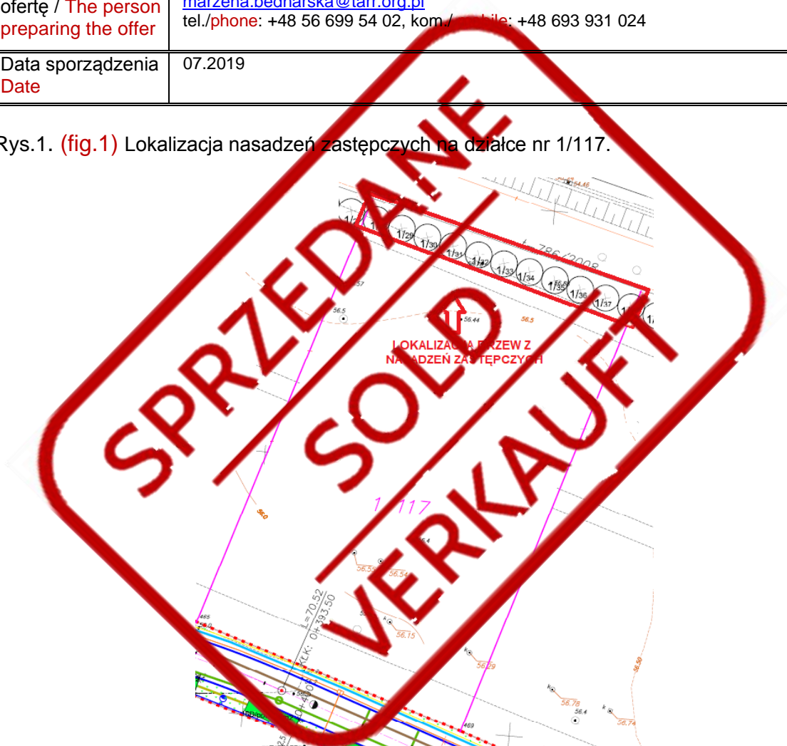
Rys.1. (fig.1) Lokalizacja nasadzeń zastępczych na działce nr 1/117.